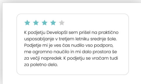
Slika 4: Komentar in ocena podjetja.