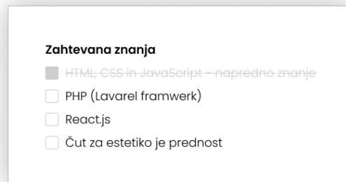
Slika 3: Seznam zahtevanih znanj kjer je znanje, ki ga delojemalec ima prečrtano.