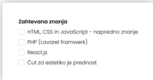
Slika 2: Seznam zahtevanih znanj s katerega lahko črtaš znanja, ki jih ima delojemalec.